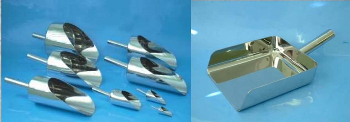
Linke Seite: PharmaScoops™ Übersicht

Durch die gratfreie Konstruktion sind PharmaScoops™ für Anwendungen mit höchsten Hygiene-Anforderungen geeignet.